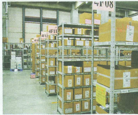
住商グローバルロジスティクスの倉庫内

る。アンケート調査は昨年11月から12月にかけて行った。通販・EC向けの物流業務を受託している物流会社にアンケート取材を実施し、15社から回答を得た。