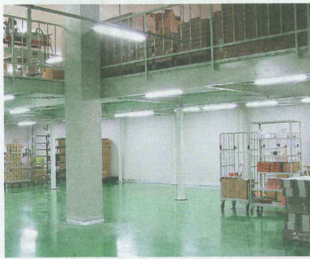
スクロール360の倉庫内